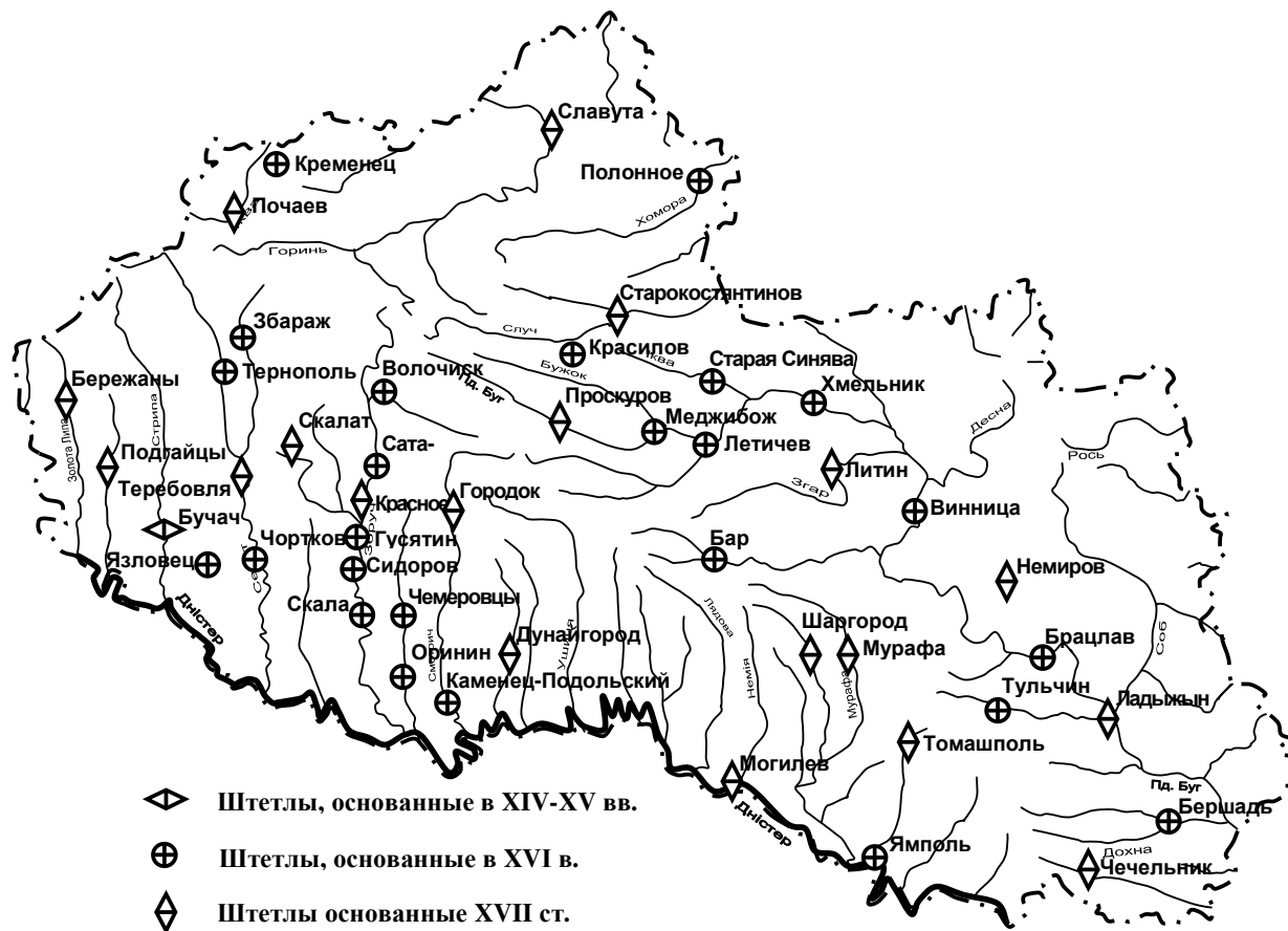
Рис. 1. Штетлы Подолья

Большинство евреев занимались торговлей и разнообразными промыслами. Например, в местечке Могилёв евреи торговали пшеницей, кукурузой, спиртом, лесом, салом, кожей с Одессой. Не все местечки, где в XIX веке по численности преобладали евреи, доминировали в историко-культурном и торгово-промышленном плане. Так, Литин, Винница, Брацлав, Новая Ушица и Ямполь, хотя и имели удобное торговое расположение (на реках), не могли конкурировать с соседями – Хмельником, Тульчином, Немировом, Могилёвом, Старой Ушицей.